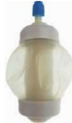
Imagen de una bomba de vacío

Al final del tiempo de infusión prescrita la membrana interna se desinfla completamente y el suave cubierta exterior va a colapsar.