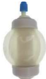
Imagen de una bomba durante la perfusión

Durante la infusión de la membrana interna disminuirá de tamaño y la tapa blanda exterior empezará a formar arrugas.