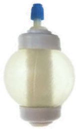
Imagen de una bomba completa

Al inicio de la infusión de la membrana interna suave y cubierta exterior será tenso, la bomba será redonda y firme.