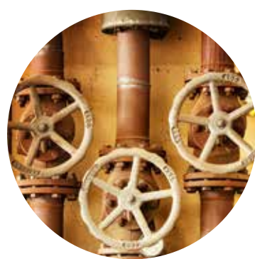
Limpieza de tuberías