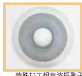
特殊加工超音波振動子

霧を発生させる心臓部の超音波振動子をはじめ、各部品は耐塩素仕様のものを採用しました。これにより従来機種に比べ約5～10倍の耐久性を実現しました。(当社比)