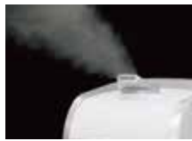
霧が良く飛び出す出口

電源ONですぐに霧が発生し、効率よく次亜塩素酸水を放出、室内の除菌・消臭ができます。また 噴霧する霧は熱くない のでお子様やお年寄りがかかり触ってしまった場合もヤケドの心配がなく、どなたにも安心してお使いいただけます。