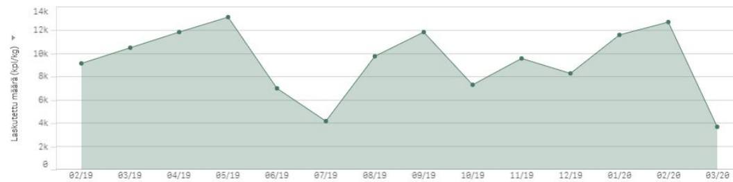
Lasketut ostot € (ALV%) kuukausien mukaan