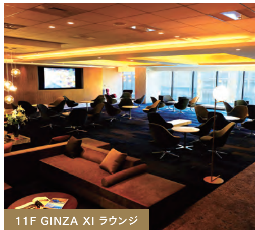
11F GINZA XI ラウンジ