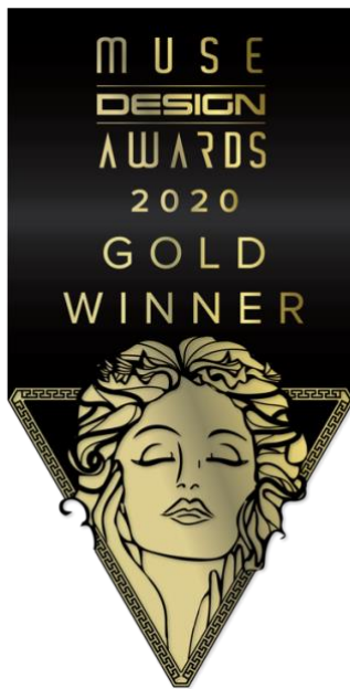
Abb.4 MUSE Design Award 2020

Der Muse Design Award ist eine weltweite Auszeichnung, die herausragende und innovative Designs in zahlreichen Branchen prämiiert. Über 3820 Einreichungen aus 50 Ländern sind 2020 eingegangen. Internorm erhielt den Award für das KF 520 im Bereich Produkt-Design in der Kategorie Gold.