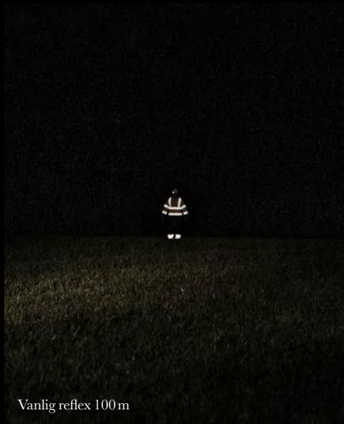
Vanlig reflex 100 m