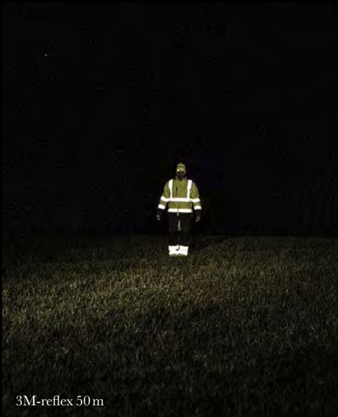
3M-reflex 50 m