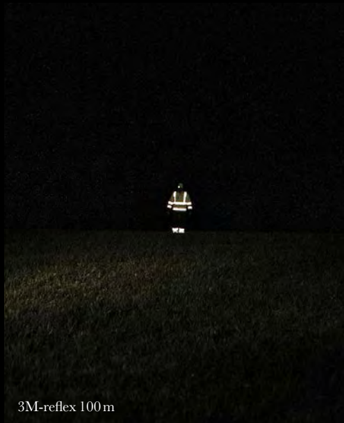
3M-reflex 100 m