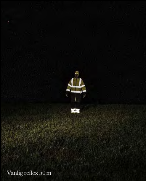
Vanlig reflex 50 m