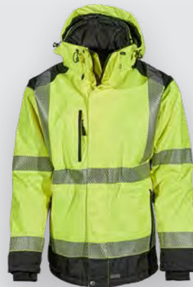
WINTERGUARD™ LONG / HI-VIS