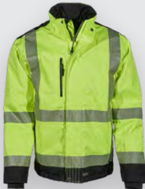
WINTERGUARD™ SHORT / HI-VIS