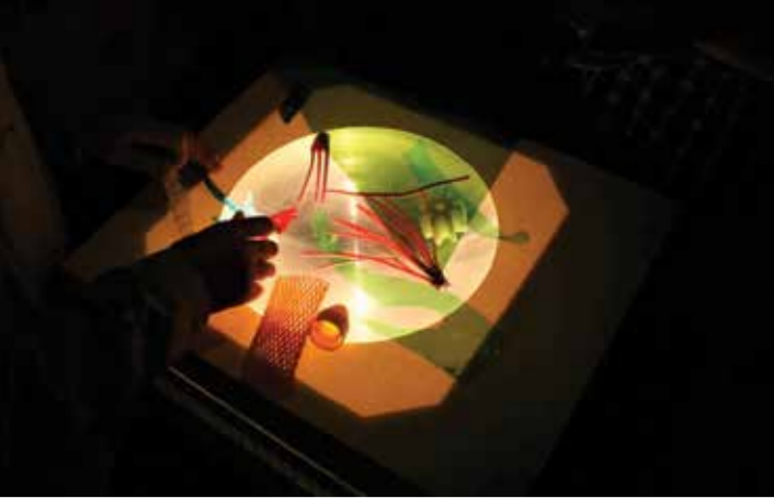
PLASTICUS MARITIMUS - REALIDADE AUMENTADA © MANUEL RUAS MOREIRA