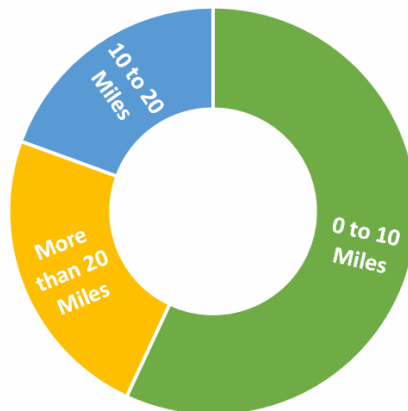
Covanta Essex Workforce Proximity to Facility

Covanta está comprometida con ser un miembro activo y solidario de la comunidad. Tenemos la responsabilidad de retribuir invirtiendo en Newark, proporcionando empleos para los residentes y apoyando con las oportunidades de desarrollo educativo, ambiental, social y económico según sea apropiado. Casi una cuarta parte de los empleados de Covanta Essex viven a menos de cinco millas de las instalaciones – más de la mitad viven en un rango de diez millas (consulte el diagrama a continuación).