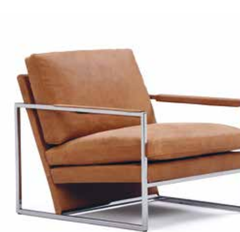
LT M = Matalaselkäinen tuoli LT M = Chair with a lower back