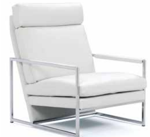
LT K = Korkeaselkäinen tuoli LT K = Chair with a higher back