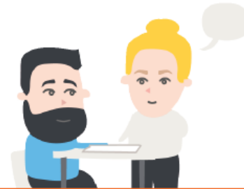
Oppimis- ja työskentelyvalmiudet