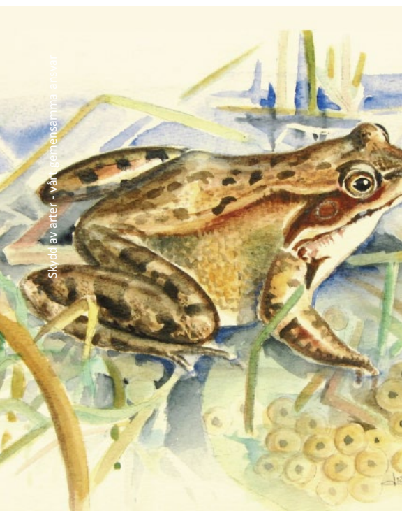
Skydd av arter - vårt gemensamma ansvar