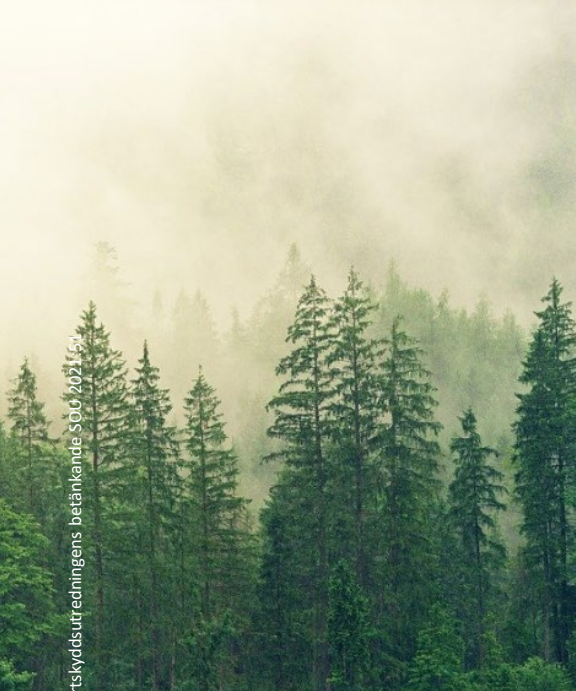
Artskyddsutredningens betänkande SOU 2021:51